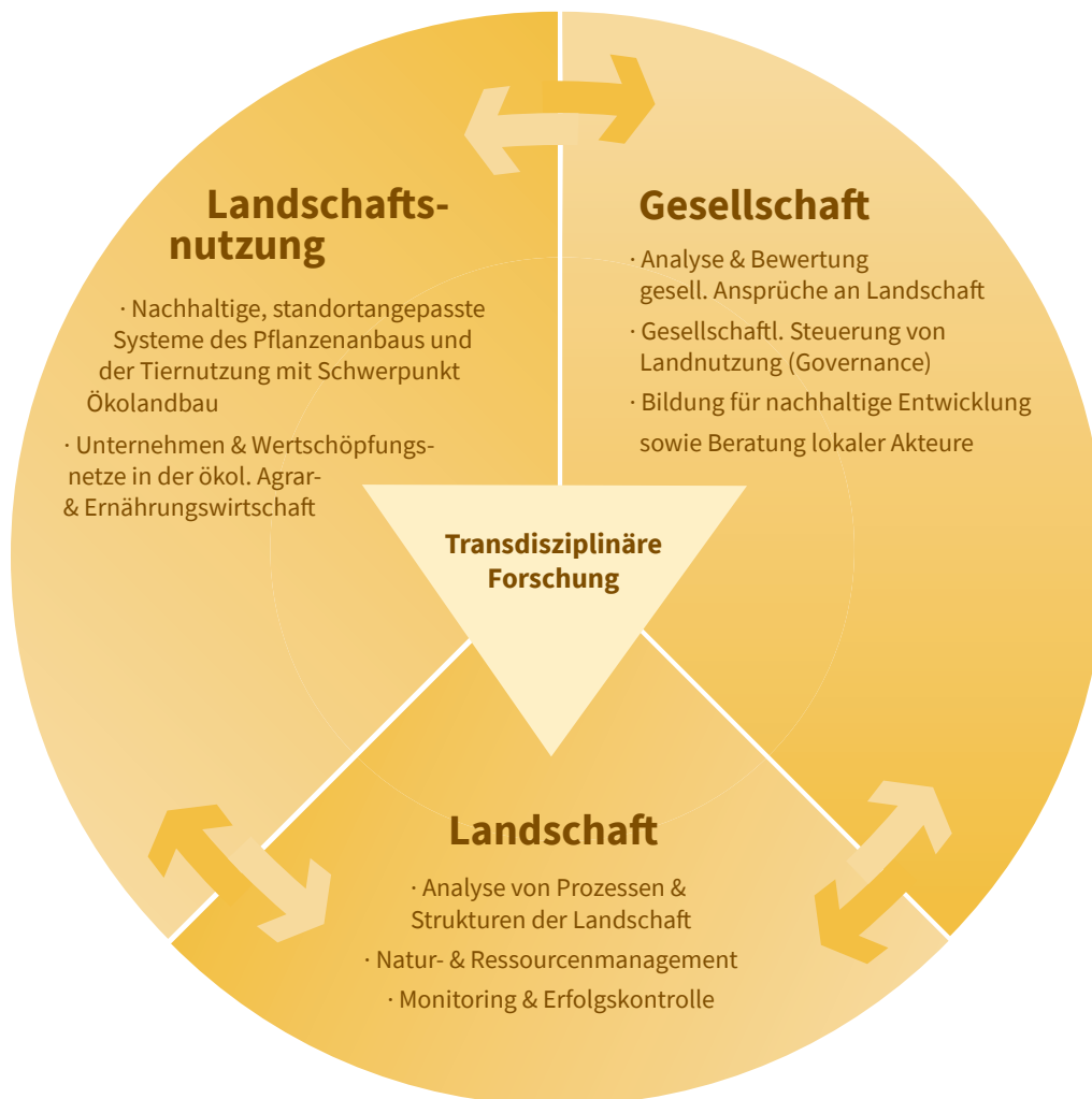
Abb. 2: Übersicht über die Forschungsbereiche am Fachbereichs Landschaftsnutzung und Naturschutz

Die drei Forschungsbereiche vertiefen jeweils unterschiedliche thematische Schwerpunkte und Fragestellungen. Diese Schwerpunkte werden als Forschungsgebiete spezifiziert und bilden die Vielfalt der Forschungsaktivitäten am Fachbereich ab.